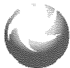
Tabuľka č. 2